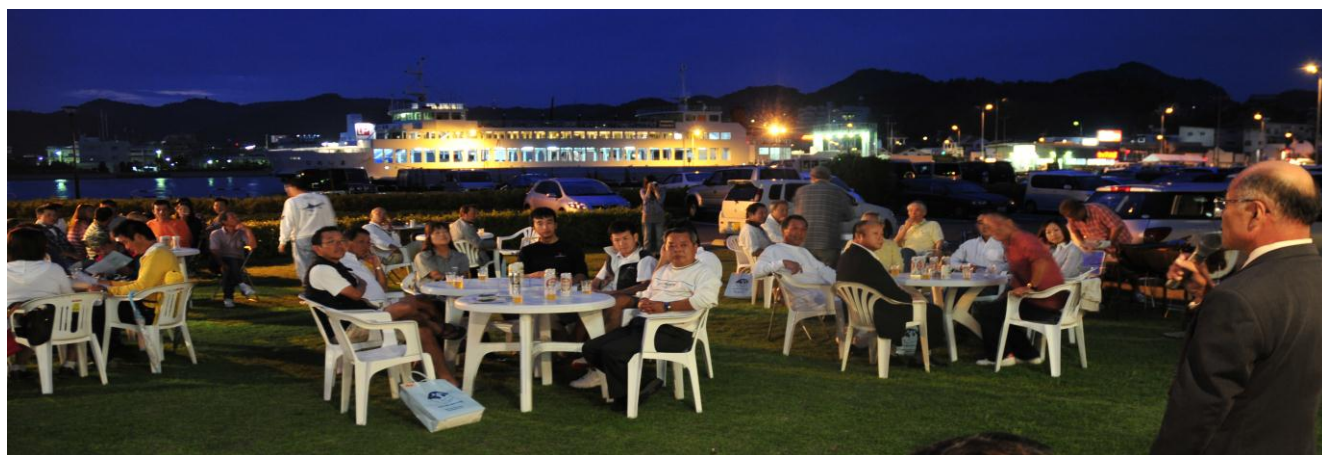
宇野港をバックに前夜祭