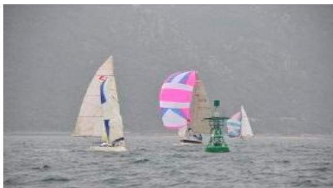
前回第31回レースの一幕